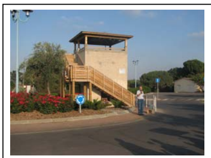
הפילבוקס לאחר השיפוץ

מהרטיי – בקתה אתיופית אותנטית, בה מתקיימות סדנאות, הפעלות, סיפור העלייה מאתיופיה, מנהגים, מאכלים ומסורות.